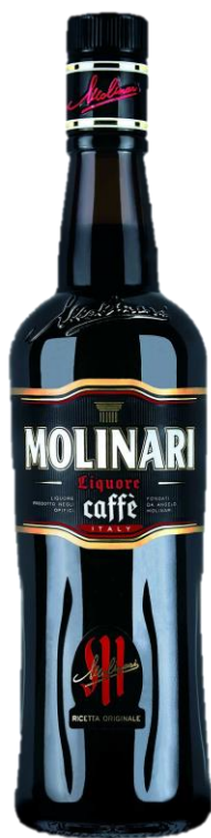
MOLINARI CAFFÈ' 36° CL 3 | 70