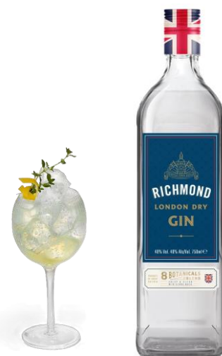
RICHMOND 37.5° - CL 70 | 100

Il mastro distillatore ha trovato l'ispirazione dalla più grande e variegata collezione di piante al mondo del Royal Botanic Gardens di Kew, creando una fusione di otto botaniche selezionate a mano.