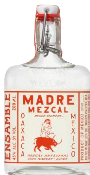
MADRE ENSEMBLE 45°