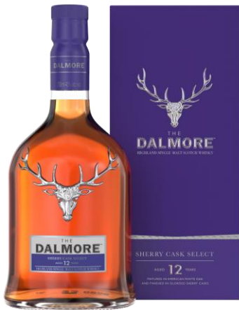
THE DALMORE 12 YO SHERRY CASK 40°