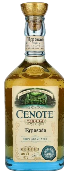
TEQUILA CENOTE 40° | BLANCO - REPOSADO