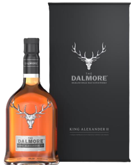
THE DALMORE KING ALEXANDER III 40°