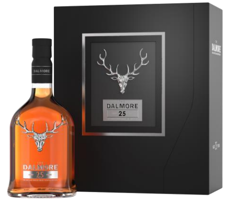
THE DALMORE 25 YO 42°

Fondata da Sir Alexander Matheson, imprenditore e uomo d'affari internazionale, The Dalmore nacque con un obiettivo diverso: creare un whisky single malt sontuoso, diverso da qualsiasi altro. Oggi, The Dalmore continua su questa strada come pionieri nell'attenta cura delle botti, dando vita a un whisky dalla profondità leggendaria.