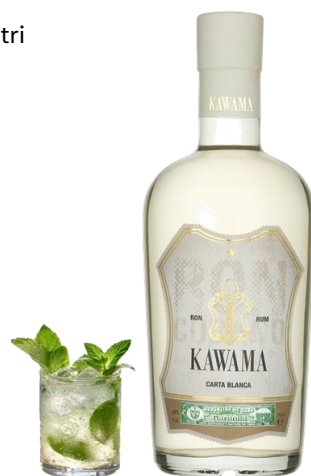
KAWAMA 32° | 38° | 40° CL 70