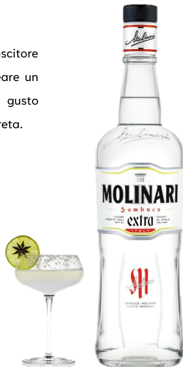
MOLINARI EXTRA 42° CL 3 | 10 | 70 | 100 | 150 | 300