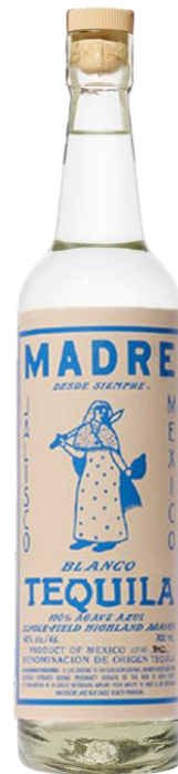
MADRE TEQUILA 48°