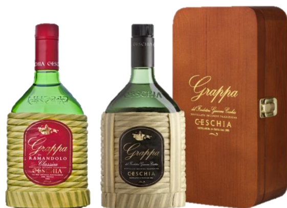
GRAPPA CESCHIA 50° GRAPPA RISERVA CL 50 | 70 | 150 GIACOMO CESCHIA 60° CL 70

Situata nella meravigliosa “conca” di Ramandolo dov’è prodotto l’omonimo grande vino, la distilleria Ceschia continua a distillare con la stessa passione e pazienza di quando, nel 1886 a Nimis in provincia di Udine, Giacomo Ceschia andava di paese in paese con il suo carretto a raccogliere le vinacce e la frutta dagli agricoltori distillandole nell’alambicco da lui stesso costruito.