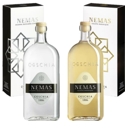
GRAPPA NEMAS BIANCA/BARRIQUE 40° CL 5 | 70 | 300

Nemas, l'antico nome di Nimis, sede della Distilleria Ceschia, nasce dalla distillazione artigianale di vinacce fresche, provenienti dalle pregiate uve coltivate tra le incantevoli colline del Friuli, con il classico alambicco discontinuo a caldaiette.