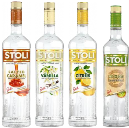
STOLI VODKA FLOVERED 40° CL 70

La qualità superiore di Stoli® è stata costantemente riconosciuta e celebrata nel corso della nostra storia. Con oltre 100 premi dai più prestigiosi concorsi internazionali, la vodka Stoli® è tra le vodka più apprezzate al mondo.