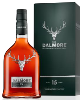
THE DALMORE 15 YO 40°