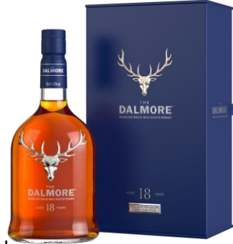
THE DALMORE 18 YO 43°