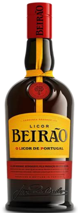
BEIRÃO 22° CL 70

Una doppia distillazione in alambicchi di rame e la combinazione di tredici erbe aromatiche, semi e spezie accuratamente selezionati, il Licor Beirão è il distillato n.1 in Portogallo e presente in oltre 40 Paesi. Un Liquore deliziosamente dolce e piacevole, molto apprezzato dalle donne e da coloro che preferiscono bevute facili. Ideale per cocktail semplici ma sorprendenti.