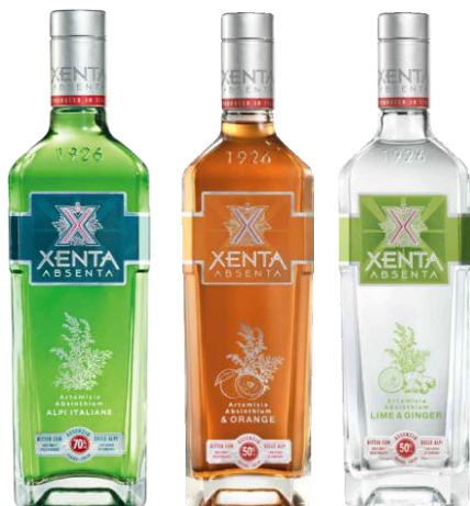
XENTA ABSENTA 70° LIME-GINGER ORANGE 50°

Ottenuto secondo una formula segreta che, prevede una lunga ed accurata macerazione di dieci erbe e spezie di provenienza prevalentemente alpina, nasce un elisir dall'aroma delizioso e dal sapore speziato ed avvolgente.