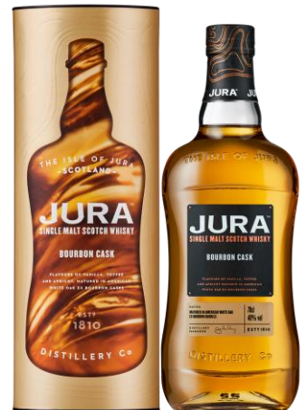
JURA - 12YO SINGLE MALT 40°