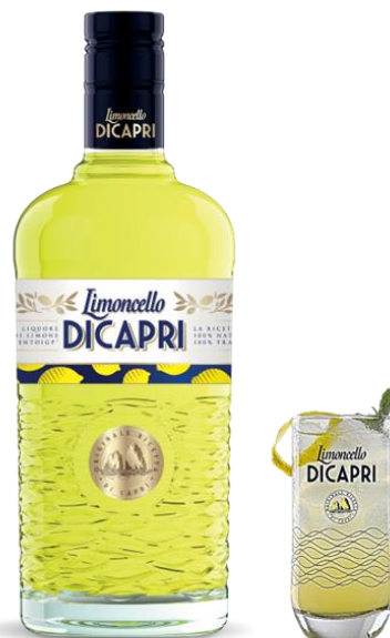
LIMONCELLO DI CAPRI 30° CL 50 | 100 |