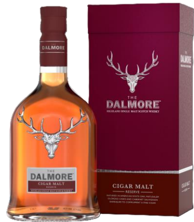
THE DALMORE CIGAR MALT RESERVE 44°