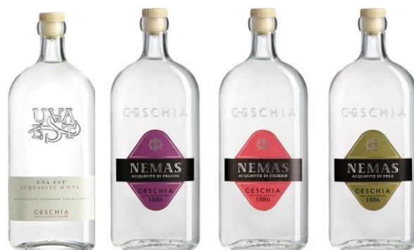
UVA EST PRUGNE CILIEGIE PERE