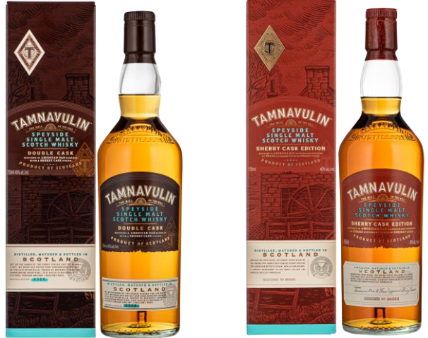
TAMNAVULIN - SINGLE MALT DOUBLE CASK 40°