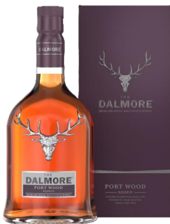
THE DALMORE PORT WOOD RESERVE 46.5°