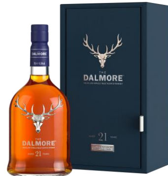
THE DALMORE 21 YO 43.8°