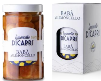
BABA' AL LIMONCELLO - 600gr/10° CL 50

Morbidi capolavori di raffinata pasticceria artigianale, a base di ingredienti naturali di altissima qualità, in un connubio irresistibile di dolcezza e fragranza.