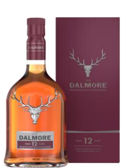
THE DALMORE 12 YO 40°