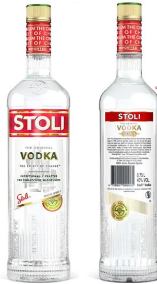
STOLI VODKA PREMIUM 40° CL 70 | 100